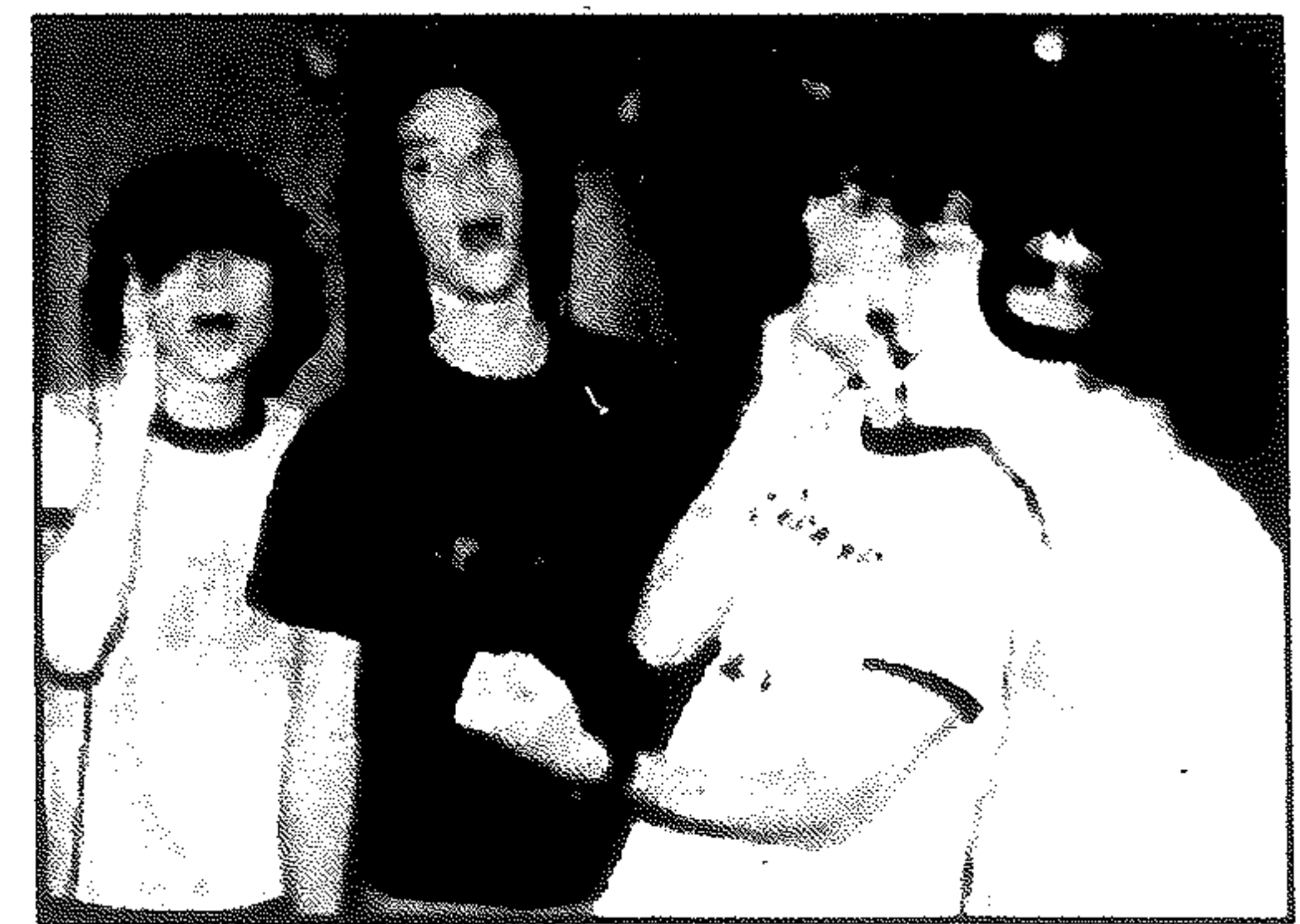
Un groupe de jeunes Manitobains qui débarque à St-Denis avec l'intention de nous conquérir. Piste de chameau au Town Hall , vendredi à 21 h 45