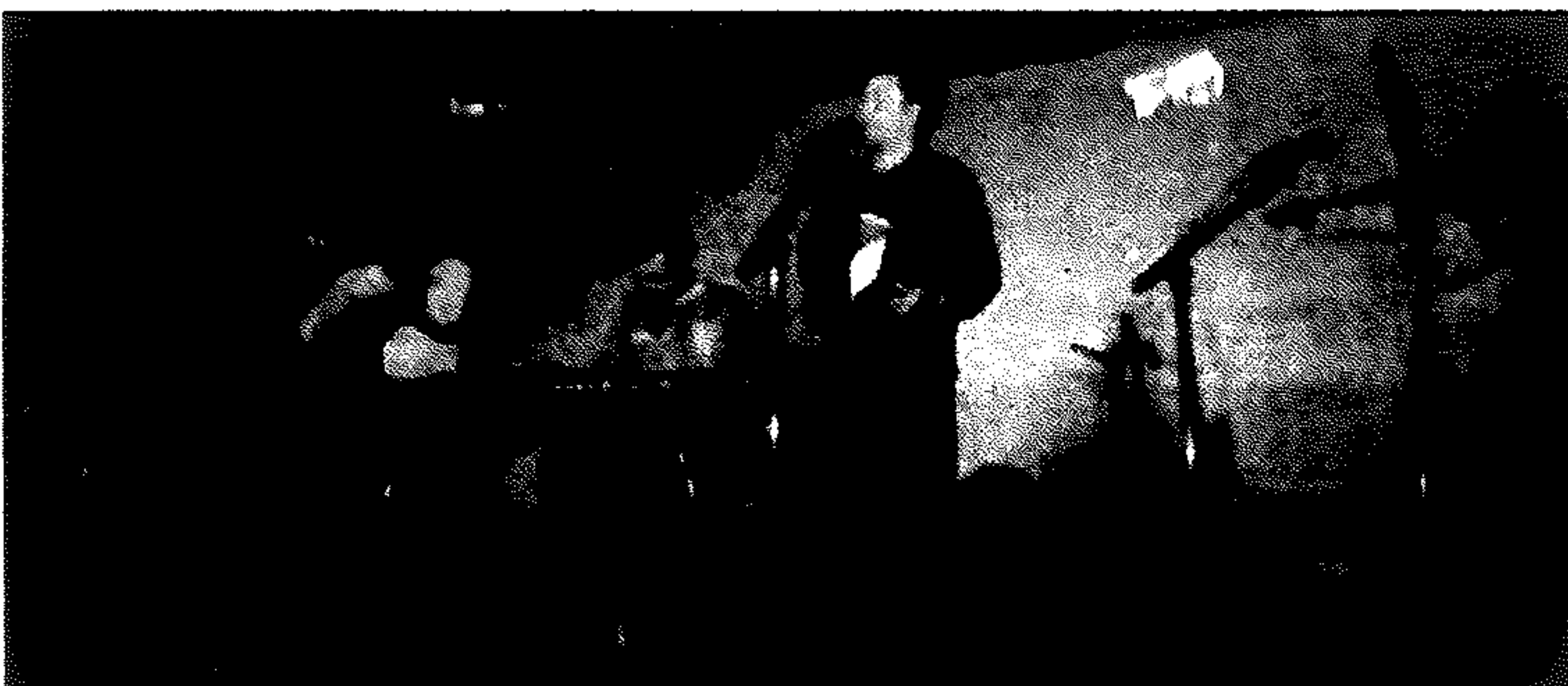
La Raquette à claquettes est partout ces temps-ci. Malgré un été fort occupé, le groupe ne pouvait pas manquer le rendez-vous de la Fête fransaskoise. En spectacle sous la tente samedi à 21 h 15.