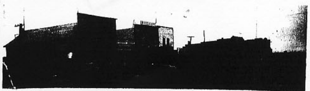
Côté ouest de la grande rue de Ponteix au début du siècle.