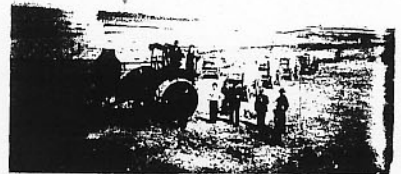
Les fermiers d'autan de Ponteix.

Regardez à ce bref petit portrait de Ponteix. La population se maintient à 700 habitants dont 78% sont d'origine de langue française. Jusqu'à dernièrement