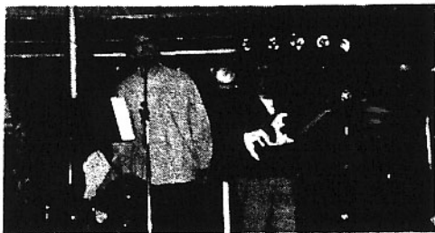
Les douzes membres dynamiques de Baraka ont fait revivre la chanson française de ce siècle.