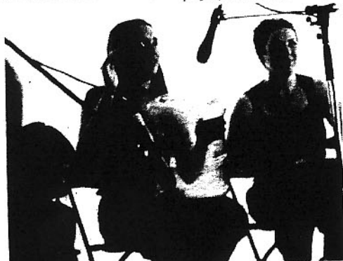
Le groupe manitobain, Madrigal a fait preuve d'extravagance à la Fête.