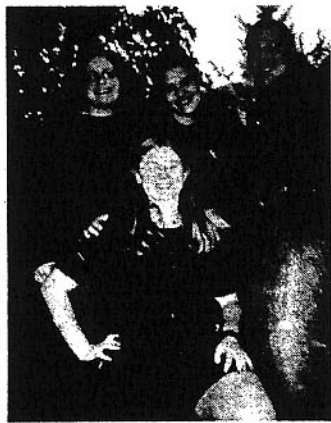
Ces quatre jeunes avaient bien hâte de pratiquer leur français avec de vrais francophones: «mission accomplie!»

Un autre groupe d'une dizaine de jeunes de Katimavik ont également été bénévoles lors des événements de la Fête. En tout, ces jeunes gens ont représenté plus que du tiers des 175 bénévoles tout au long de la fin de semaine.